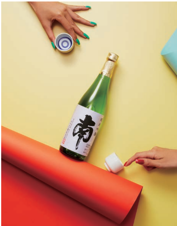
酒撮りプロジェクト 6月「南」 2017年 作品