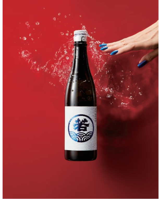
酒撮りプロジェクト 7月「若波」 2017年 作品