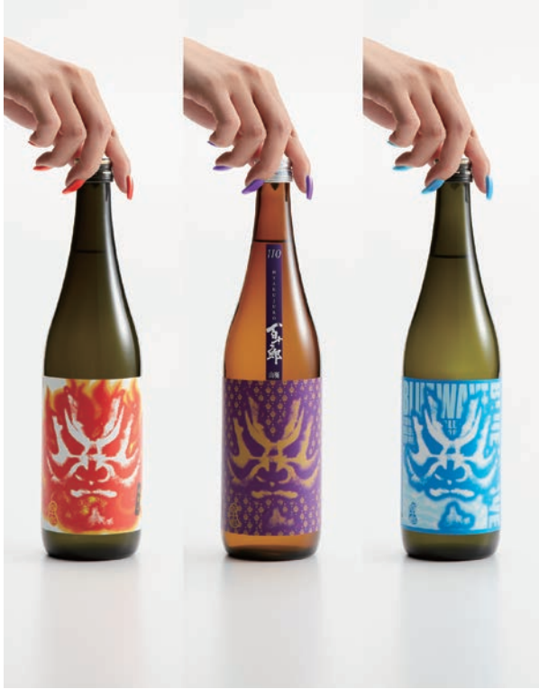
酒撮りプロジェクト 8月「百十郎」 2017年 作品

【クラッチ】ロゴ、パッケージ、ウェブサイトなど多岐にわたるグラフィックフィールドでのアートディレクション及び制作を行うクリエイティブチーム。スチール・ムービー撮影時にはキャスティング、コーディネート等のプロダクションも行い制作一式を担う。2017年よりアーティストのマネジメントディビジョンを発足。