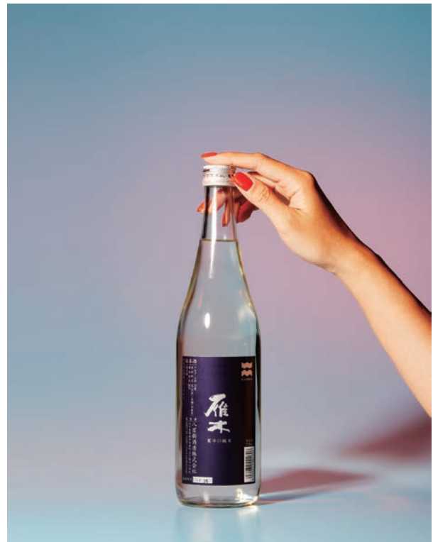
酒撮りプロジェクト 5月「雁木」 2017年 作品